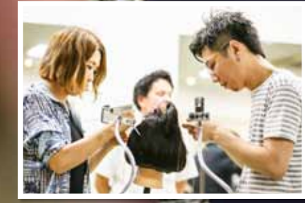
BAKUグループ 福岡県内に展開するaseグループ (EN, Slow garden, arl)、BALANCEグループ (BALANCE, RAFELIEN, JILL, LAL A)、Rose Hipの3サロンで結成する美容研究団体。合同コンテストや勉強会を通じて共存共栄を図る。