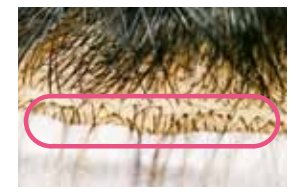
10センチ幅以内に根元から均一にループが装着されているか。写真は最優秀ウィッグの施術。根元への玉留めがしっかりできている